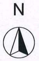
五結鄉第一公墓遷葬範圍圖